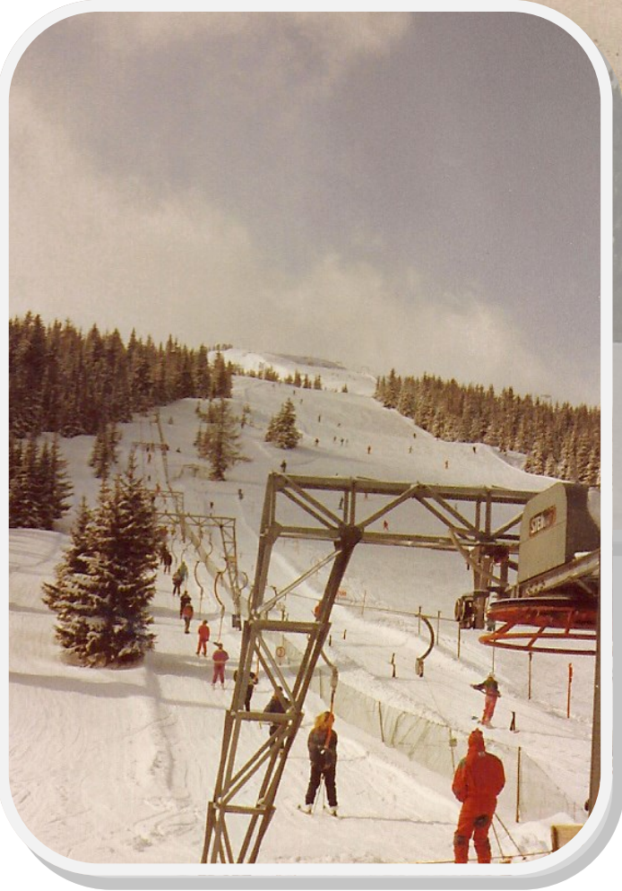
På en pragtfuld skitur med snestorm, masser af sne og flot sol